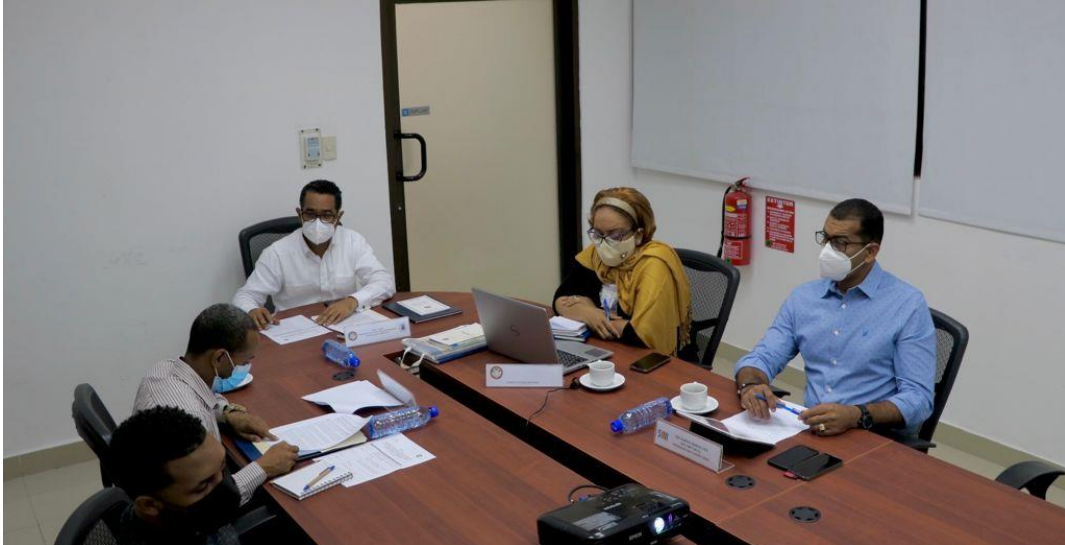
Reunión del Comité Técnico Nacional, miércoles 09 de junio.

La Comisión Nacional de Emergencias (CNE) y el Comité Técnico Nacional (CTN-PMR) realizaron las reuniones ordinarias correspondientes a junio, con los/as miembros designados por las instituciones del Sistema Nacional de Gestión de Riesgos.