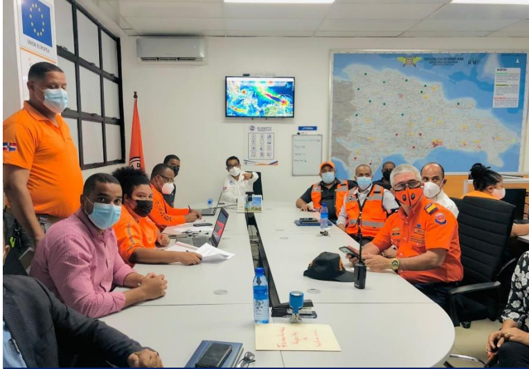
Sesión permanente desde la Sala de Situación.