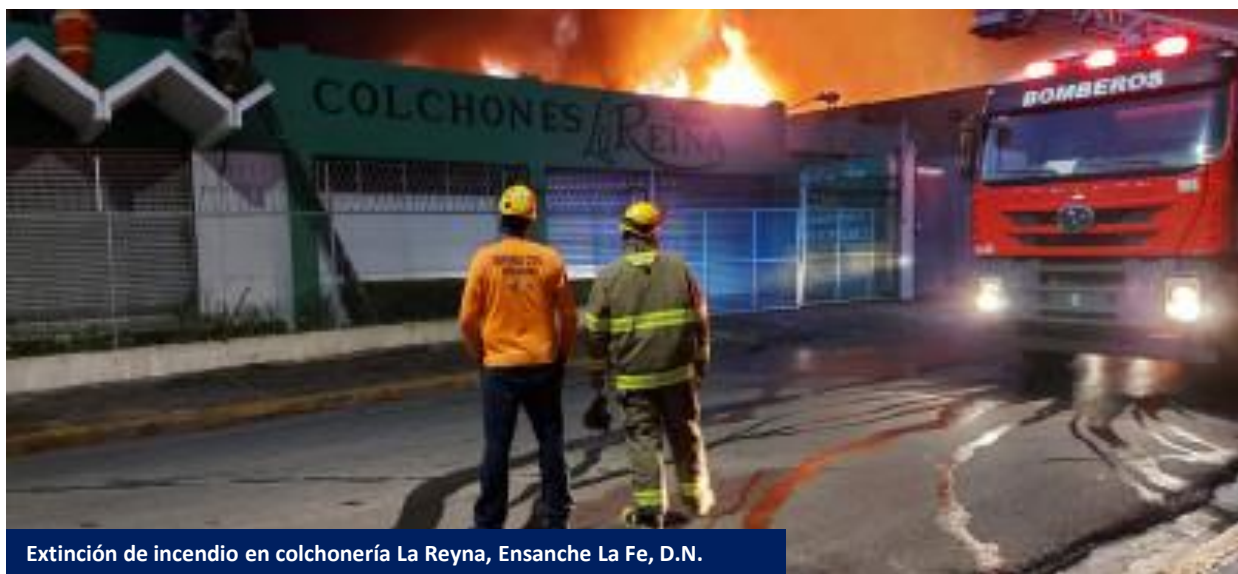
Extinción de incendio en colchonería La Reyna, Ensanche La Fe, D.N.

Cumpliendo con su deber de estar siempre al servicio de la sociedad en casos de emergencias, miembros del Departamento de Operaciones de la Defensa Civil brindaron apoyo al Cuerpo de Bomberos del Distrito Nacional, en las labores de extinción de un incendio que afectó la colchonería “La Reina” en el sector Ensanche La Fe, Distrito Nacional, el pasado 9 de junio.