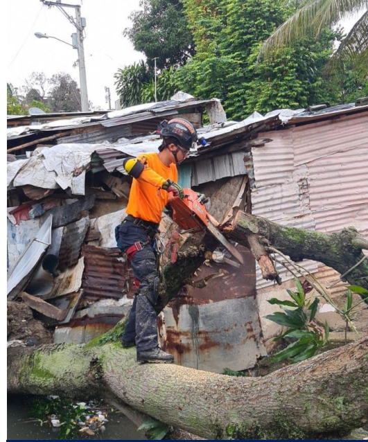
Poda de un árbol en el KM 18 de la Autopista Duarte.