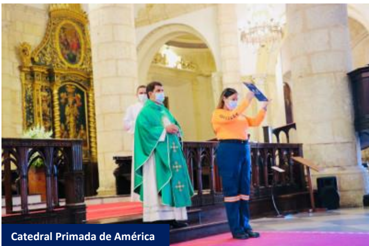
Catedral Primada de América