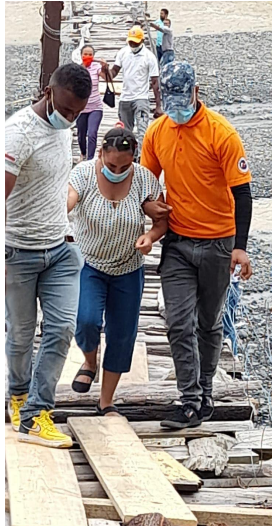
Personal de la Defensa Civil trasladada a una señora diabética cuya casa quedó incomunicada por afectación del paso de Montenegro, San José de Ocoa.