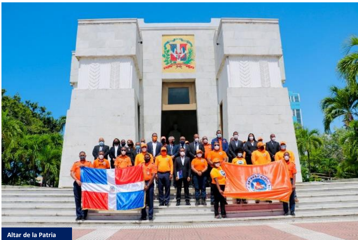
Altar de la Patria