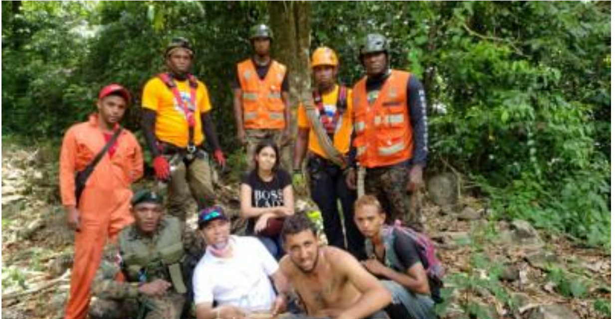
Personal de la Defensa Civil y las Fuerzas Armadas junto a jóvenes rescatados

Voluntarios de la Defensa Civil rescataron el pasado 20 de junio a dos jóvenes que habían sido reportados como desaparecidos, tras lanzarse en un parapente en la comunidad Casabito de Constanza, de La Vega.