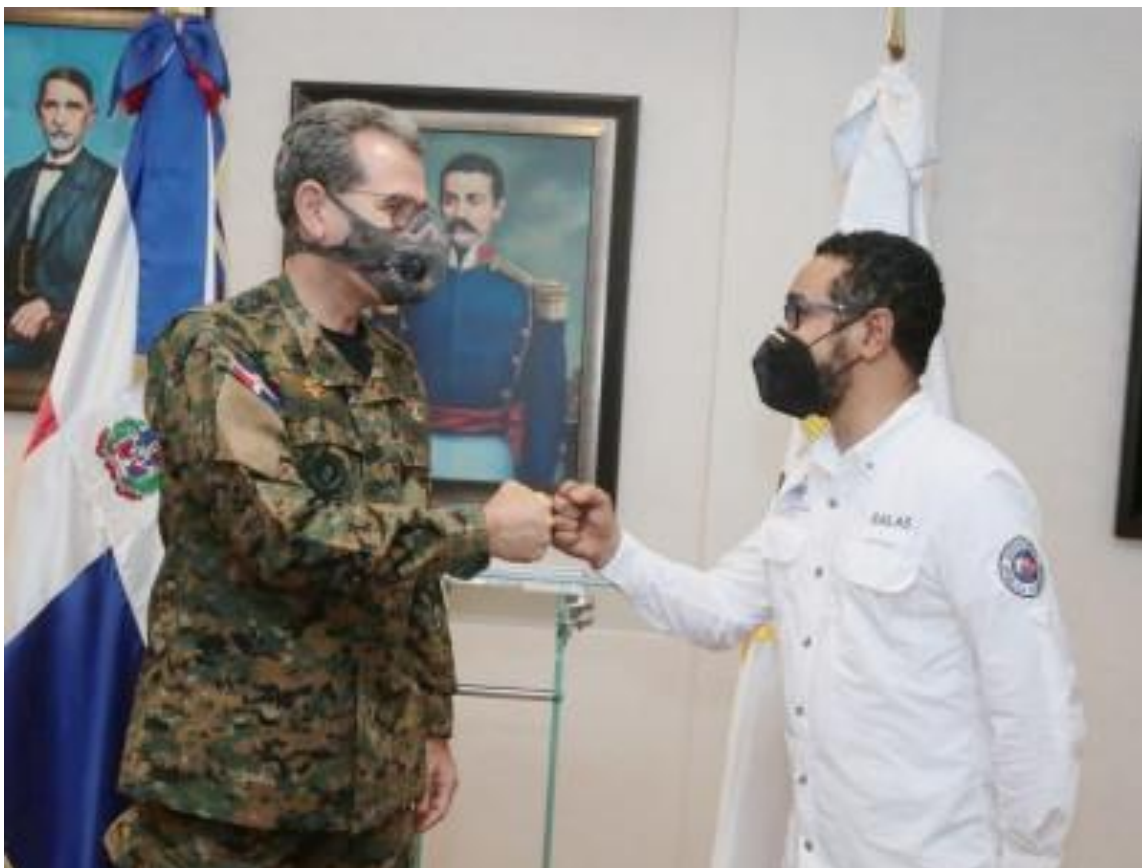
Teniente General Carlos Luciano Díaz Morfa, E.R.D., Ministro de Defensa.

En el encuentro, efectuado el pasado 21 de junio, abordaron temas vinculados con las acciones que realizan las dos instituciones para prevenir, mitigar y dar respuestas rápidas y efectivas frente a situaciones de emergencias causadas por fenómenos naturales.