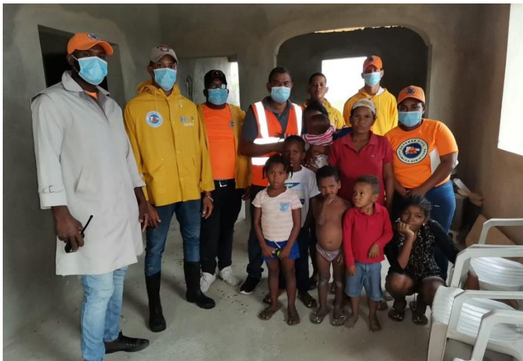
Asistencia a una familia afectada en Bahoruco